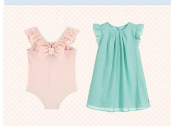
5 : Lili Gaufrette (リリー・ゴフレット)