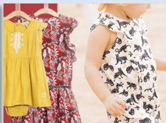
2 : IKKS (イックス)