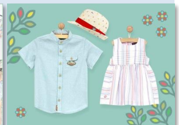
4 : SeRGENT MaJor (セルジャン・マジャール)