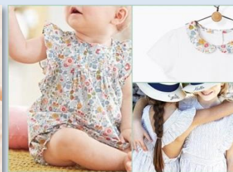
3 : Cyrillus (シリリュス)