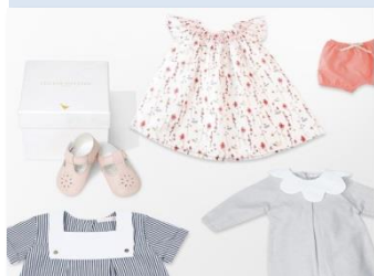
1 : LES ENFANTINES PARIS (レザンファンディーヌ)